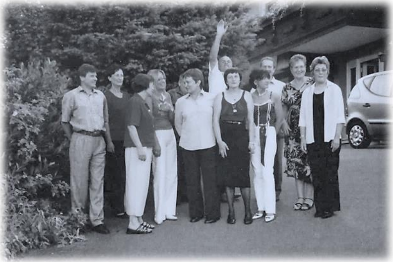
(Klassentreffen 2005, Jahrgang 1955)

Die Zeit vorgeht, es is schon klar, nechs is meh, wie es mol war. Drom wunsch ich for die vorbliebni Zeit, Gsondheit, Glick, Zufriedenheit.