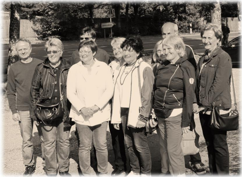
(Klassentreffen 2015, Jahrgang 1955)

Well do jo nechs behaupte, vorhalt mich ganz still. Saan's blos eich, ... ich glaab es vorsteckelt aa mei Brill. Die letschti Zeit kommt mer ee alles spanisch vor, alleritt on emmer geht mer die Brill vorlor. Ach jetz gsiehn ich's grat, es is jo aach do mei Weib, na wo war ich dann iwerhaupt stehn geblieb, liewe Leit? Ach jo, ich wollt doch nor ganz korz betone, was ich e gudi Frau han. Die toht mich oft schone. Es macht die Gartearweit, losst mich Zeidung lese, toht mer all mei Wünsch von der Aue ablese. On so Weiwer die hat's nor gen en Betscheret; ... Sen drom aach froh, dass es dich get.